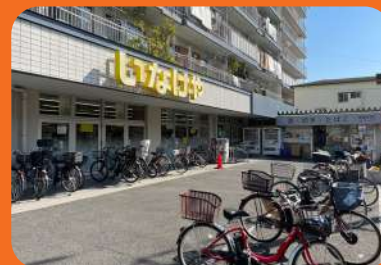
スーパーいながや