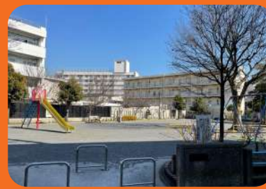
目の前に東蒔田公園

●所在地/神奈川県 横浜市中区 東田町3-15 ●交通/横浜市営ブルーライン「吉野町駅」徒歩7分、京急本線「南太田駅」徒歩9分、横浜市営ブルーライン「蒔田駅」徒歩10分 ●土地権利/所有権 ●建物構造/鉄筋コンクリート造地上7階建1階部分 ●総戸数/69戸 ●築年数/1973年10月 ●専有面積/45.00㎡ ●管理形態/全部委託管理 ●管理会社/長谷工コミュニティ ●管理費/月額8,640円 ●修繕積立金/月額8,640円 ●現況/空室 ●引渡/即可 ●取引形態/売主